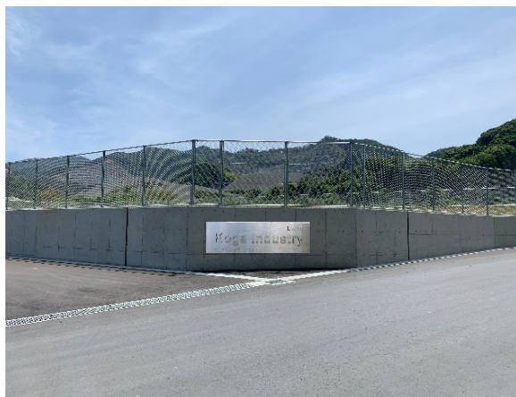
プロジェクトエリア入口

新築不動産販売から再生不動産販売、不動産賃貸まで、多様な不動産業を展開する株式会社 LA ホールディングス（本社：東京都港区、代表取締役社長：脇田栄一、東証 JASDAQ：2986）のグループ会社である株式会社ラ・アトレは、事業チャネルの多様化の方策として、成長ドライバーと位置付ける収益不動産開発事業の「ラ・アトレ古賀インダストリー」の開発を福岡県古賀市にて進めてまいりました。このたび 2020 年 6 月に当プロジェクトが完成し、当事業用地内における全 4 区画のうち現在 3 区画の引渡しが完了いたしました。なお、当社が工業団地開発を手がけるのは今回が初めてです。