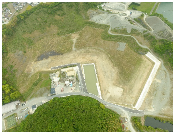
広域写真（ドローン撮影）

当社は、2015 年の福岡支店開設以降、活況に沸く福岡エリアにおいてアイランドシティ初の商業施設「アトレアモール照葉」の開発を皮切りに、物流倉庫「九大学研都市 LADC」（福岡市西区）の取得や分譲マンション「LA 大橋」（福岡市南区）の開発、長期滞在型ホテル「LA ホテル福岡」（福岡市中央区）を開発してまいりました。今年 4 月にはオフィスビル開発の第 1 号案件となる「LA HAKATA」（福岡市博多区）をはじめ、「LA ホテル福岡」シリーズの 2 棟同時開業（福岡市中央区）や分譲マンション「ラ・アトレレジデンス室見公園（仮称）」（福岡市早良区）の開発に着手するなど、多様な事業を展開しています。