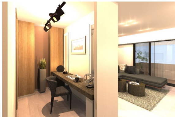
モデルルームイメージ(ワークスペース)